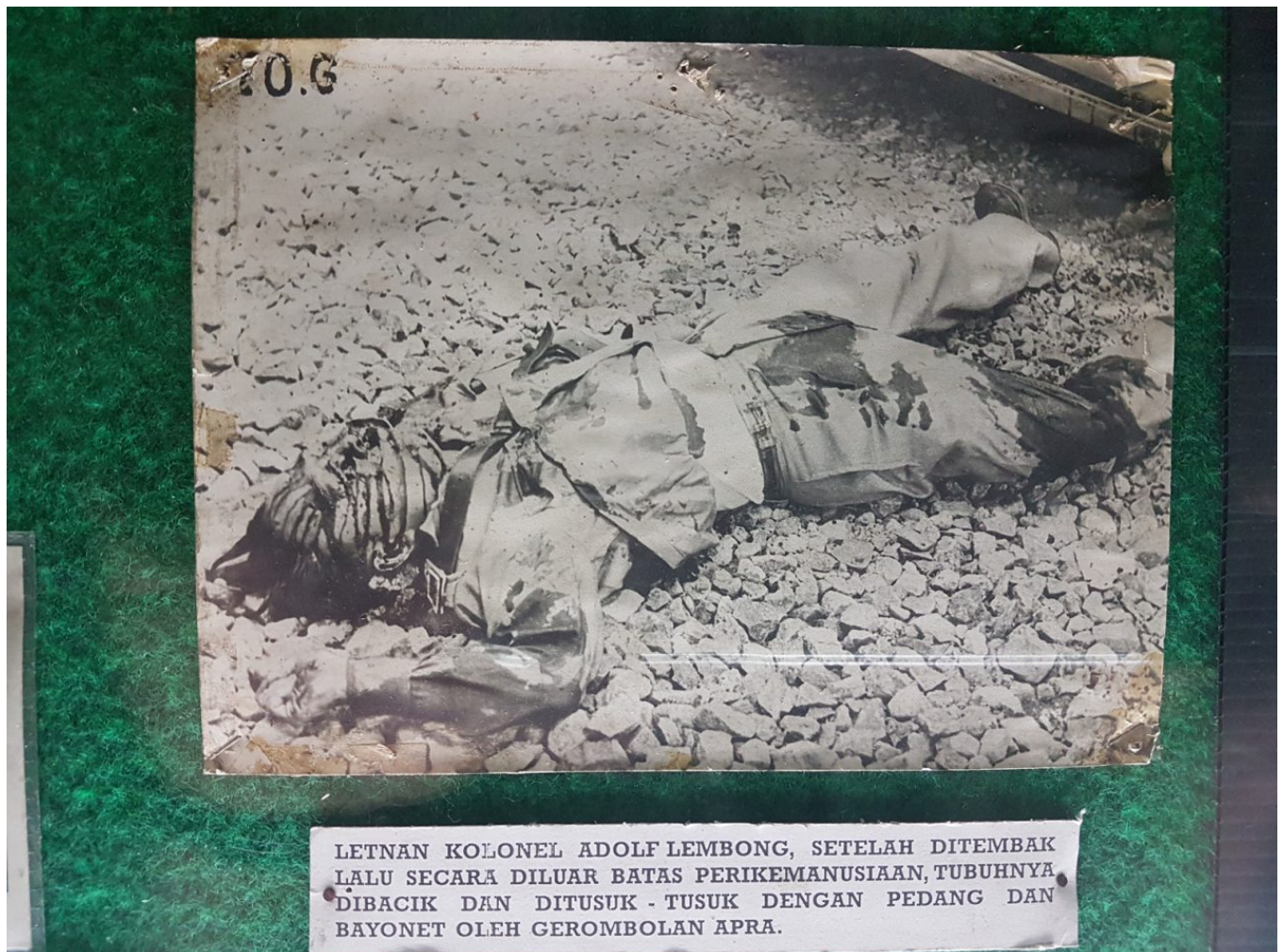
De vermoorde Adolf Lembong op een foto in het museum gewijd aan de coup van Westerling in 1950 in Bandung.

Op 19 december 1948, tijdens de tweede Agresi Militer Belanda (in Nederland eufemistisch aangeduid als 'Tweede Politie Actie'), veroveren de Speciale Troepen van het Nederlandse leger Yogyakarta en arresteren daar de Republikeinse regering. Ook Adolf wordt gevangengenomen en geïnterneerd in het voormalige jappenkamp Ambarawa.