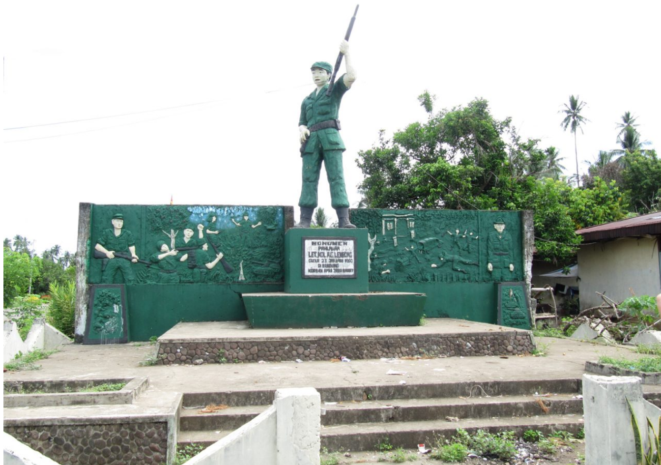
Oorlogsmonument ter ere van Adolf Lembong in Ongkaw.

in dienst was van het Koninklijk Nederlandsch-Indisch Leger (KNIL) en tijdens de Tweede Wereldoorlog in de Filipijnen als lid van een Amerikaans-Filipijnse guerrillagroep tegen de Japanners heeft gevochten.